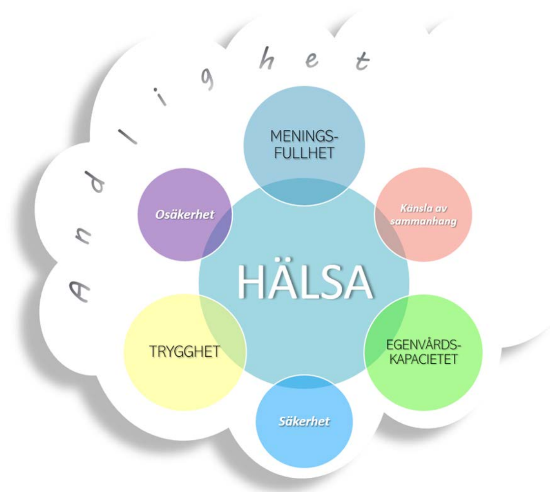
Figur 1 Resultatets hälsokomponenter

resultat som påminner om varandra så att vi inför resultatredovisningen ska ha ett mera hanterbart material. Underkategorier blir känsla av sammanhang , säkerhet och osäkerhet . En alltomspännande kategori är andlighet som ger synergieffekter på samtliga kategorier (se figur 1). En annan orsak till litteraturoversikten är att den utförs för att man ska bli förtrogen med den litteratur som finns i det ämne man forskar i och för att ta reda på om den studie man planerar att utföra redan har genomförts tidigare. (Notter & Hott, 1996, pp. 73-75)